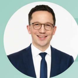
Falko Mohrs, Niedersächsischer Minister für Wissenschaft und Kultur

Herzstück des Internetportals ist ein Veranstaltungskalender mit zahlreichen komfortablen Funktionen. Aktuell beinhaltet die Veranstaltungsübersicht über 700 Veranstaltungen in ganz Ostfriesland. Das Portal soll kontinuierlich wachsen. Alle Kulturtätigen haben die Möglichkeit, ihre Veranstaltungen kostenfrei einzustellen.